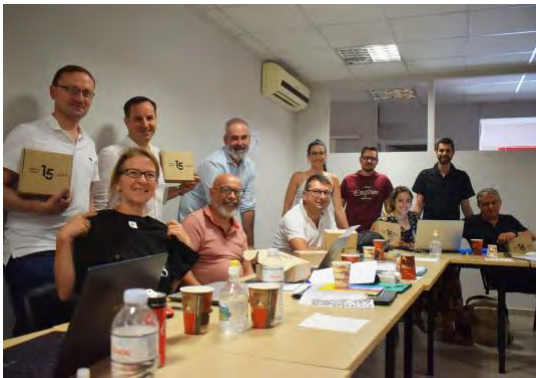
Η κοινοπραξία που εργάζεται στο έργο κατά τη διάρκεια της συνάντησης στην Αθήνα

Αυτή η συνάντηση, όσο δύσκολο κι αν ήταν να οργανωθεί, ιδίως για τα ταξίδια και τους περιορισμούς της, τελικά επιτεύχθηκε.