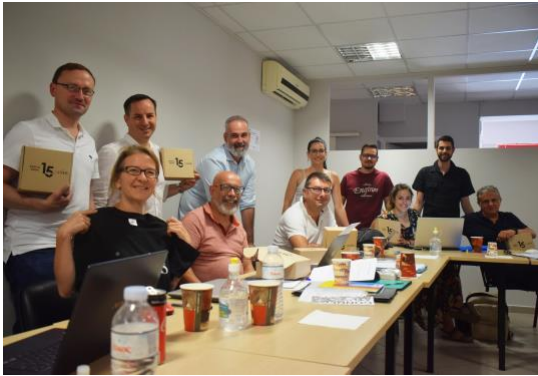
L'équipe travaillant sur le projet lors de la réunion à Athènes

Ce meeting pourtant délicat à organiser notamment pour les déplacements et ses contraintes a finalement pu se réaliser. Nous remercions l'association IASIS qui a pu réunir, les 23 et 24 juillet 2020, l'ensemble des partenaires dans ses locaux en suivant toutes les mesures de prévention possibles. Nous avons pu prévoir et structurer la suite du projet sur les productions et la dissémination. Un calendrier reconfiguré donne un nouvel équilibre des délais prévus et le prochain meeting à Paris se déroulera en janvier 2021 et sera suivi du séminaire de formation début février à Bastia.